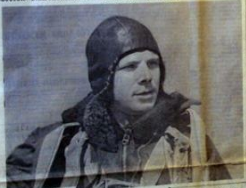
ЮРИЙ АЛЕКСАНДРОВИЧ ГАГАРИН

12 АПРЕЛЯ 1961 ГОДА В 10 ЧАСОВ 55 МИНУТ КОСМИЧЕСКИЙ КОРАБЛЬ-СПУТНИК «ВОСТОК» БЛАГОВОЛУЧНО ВЕРНУЛСЯ НА СВЯЩЕННУЮ ЗЕМЛЮ НАШЕЙ РОДИНЫ