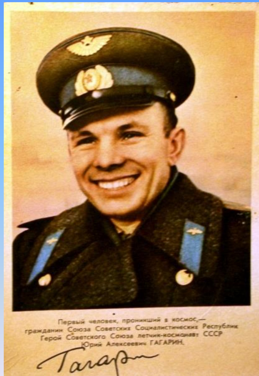
Первый человек, проникший в космос, — гражданин Союза Советских Социалистических Республик Герой Советского Союза летчик-космонавт СССР Юрий Алексеевич ГАГАРИН.

Не попросив подмог ни у кого, Сама восстав из пепла и из праха, Моя страна, не знающая страха, Шлет в космос ныне сына своего.